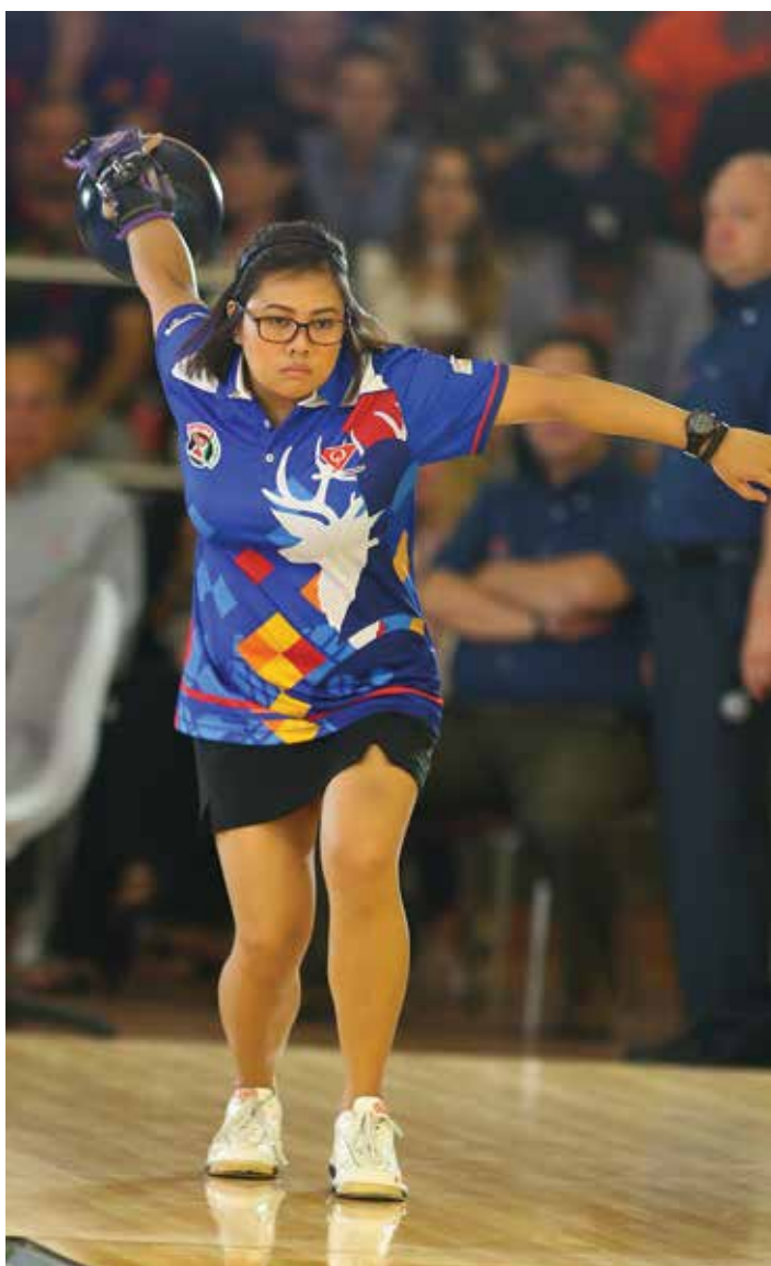
Un grand merci à Maître Hiroshi Noda , photographe officiel de la Coupe du Monde pour ses magnifiques photos !